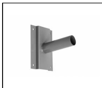
Wandhalterung- grau (314056)

Erstellungsdatum der Karte: 19 november 2020