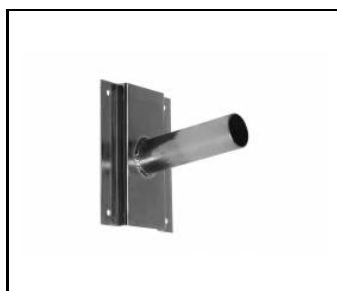
Wandhalterung- verzinkt (314049)