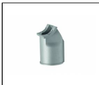
Halterung 76MM (UL00141)