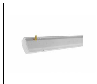
TYTAN MULTI LED 1150mm 2500-4300lm 840 - Lichtmodul (358937)