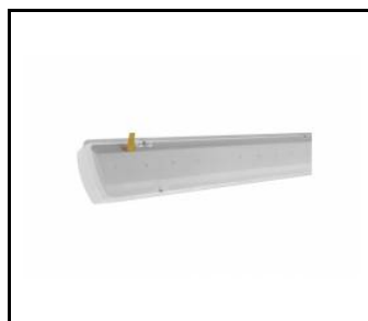
TYTAN MULTI LED 1450mm 6300-10800lm 840 - Lichtmodul (358968)