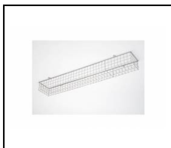
TYTAN - Schutzgitter 1152mm (907913)