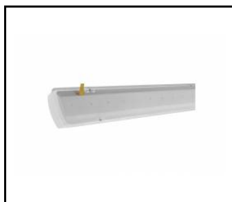
TYTAN MULTI LED 1450mm 3150-5450lm 840 - Lichtmodul (358951)