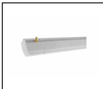
TYTAN MULTI LED 1150mm 5000-8700lm 840 - Lichtmodul (358944)